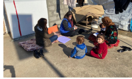
الدعم النفسي والاجتماعي PSS