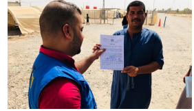
الخدمة القانونية المجانية الاستشارات القانونية المجانية