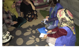
الحد من العنف المبني على النوع الاجتماعي